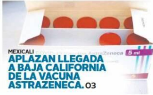
MEXICALI APLAZAN LLEGADA A BAJA CALIFORNIA DE LA VACUNA ASTRAZENECA. 03