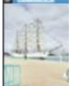
EN LA BAHÍA DE ENSENADA