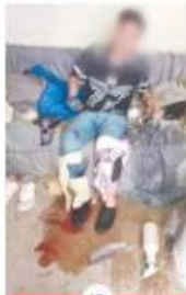
18 POLICIACA BALEAN A HOMBRE EN CALIFORNIA RESIDENCIAL