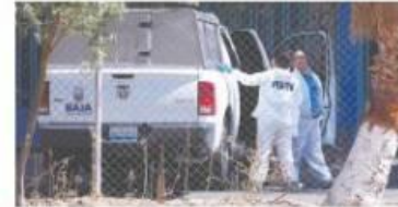
ESPECIAL ES BC SEGUNDO EN HOMICIDIOS DOLOSOS. 05